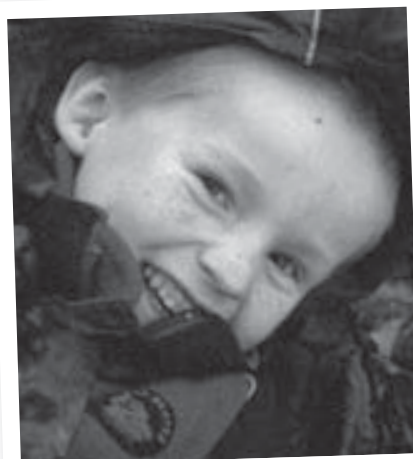
At få bedre kontakt med sine børn...