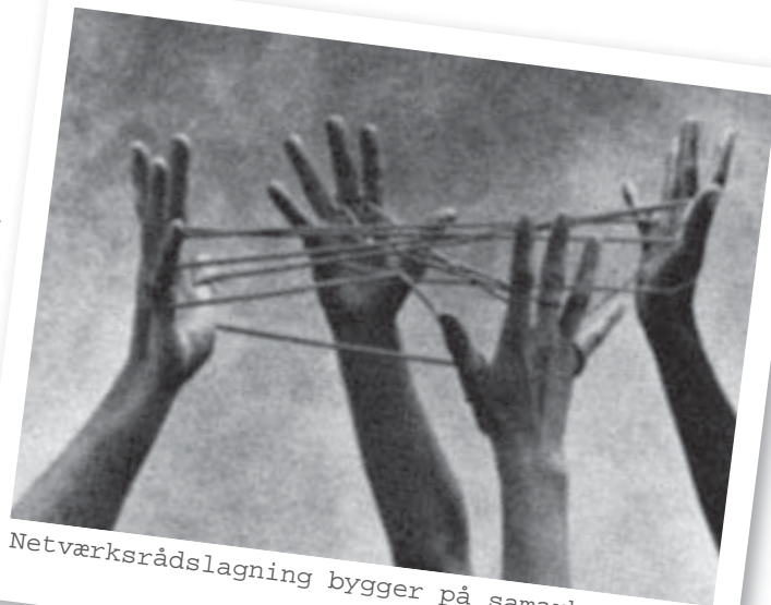
Netværksrådslagning bygger på samarbejde...